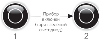
Схема 2. Включение фонаря (работает только в состоянии включенного металлоискателя)

Нажмите и удерживайте кнопку до появления звукового сигнала